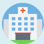
2019- yil ambulatoriya-poliklinika muassasalari soni , birlikda

Viloyat hududidagi ambulatoriya-poliklinika muassasalarining bir smenadagi quvvati 36 643 nafar kishiga to'g'ri kelgan bo'lsa yil davomida ambulatoriya-poliklinika muassasalariga qatnovlar soni 29 455 673 nafar kishini tashkil qilgan.